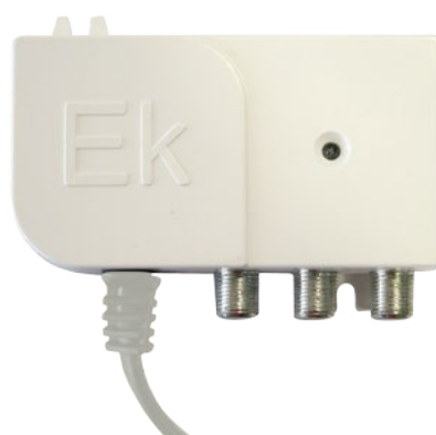
FA 24 MINI