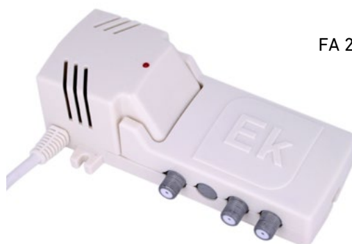
FA 242 / FA 121